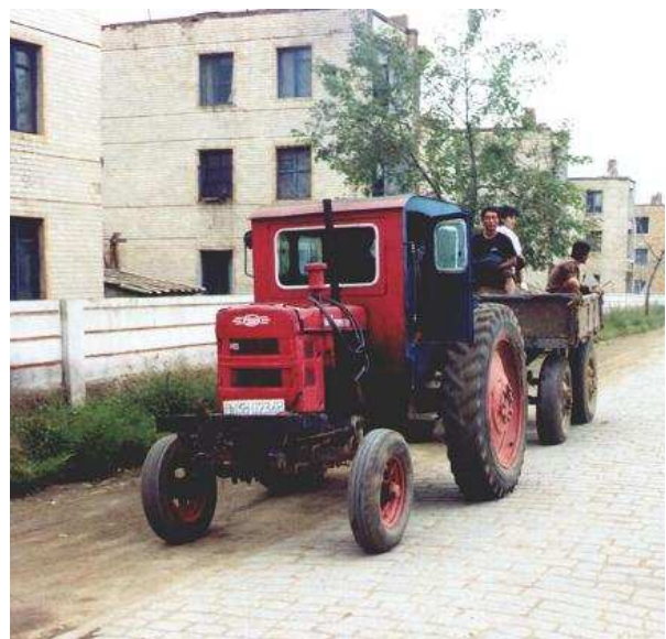
Billeder fra hverdagen i DDF Korea

stiger fra 110 til 2000 won. Man har indført en art fredelig socialistisk kappestrid , hvor lønnen bedømmes på kvaliteten og kvantiteten af arbejdet såvel som arbejderens bidrag til landets økonomiske udvikling. I tråd med dette stiger kulminearbejdernes grundløn til 6000 won. Alt dette sker med ét klart sigte, nemlig at skabe mere velfærd og sikre større investeringer i økonomisk udvikling. En ansat i DDF Koreas priskontrolbureau understreger således vigtigheden af, at den enkelte arbejder forstår resultatet af hans egen (økonomiske) indsats. Uanset dette vil alle indbyggere fortsat nyde goder som gratis sundhedssystem og gratis uddannelse. Generalsekretær Kim Jong Il kunne således på et møde med den russiske udenrigsminister Ivanov (nu forhenværende) i Pyongyang fortælle, at de nye økonomiske metoder vil tilvejebringe en radikal ændring af økonomien og drastisk forbedre folkets engagement.