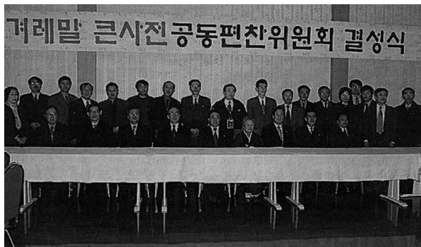
Fra åbningsceremonien for arbejdet med den nye store koreanske ordbog i Kumgang den 20. februar.

Ordbog Mun Yong Ho sagde i en åbningstale, at det vil ske hurtigst muligt.