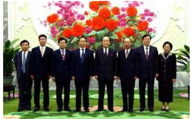
Wang Jiarui fra Kinas Kommunistiske Parti og hans delegation ses her sammen med parlamentsformand kammerat Kim Yong Nam i Pyongyang.

Lederen af den internationale afdeling i Kinas Kommunistiske Partis centralkomite Wang Jiarui aflagde besøg i Pyongyang i dagen 19.-22. februar 2005 i anledning af DDF Koreas tilbagetrækning fra 6-partsforhandlingerne.