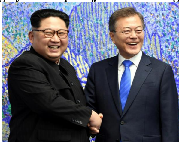
DDF Koreas øverste leder Kim Jong Un ses her sammen med Sydkoreas præsident Moon Jae In.

Som tidligere meddelt i medlemsbrevet i maj 2018 blev der den 27. april 2018 afholdt et historisk inter-koreanske topmøde mellem DDF Korea's leder Kim Jong Un og Sydkoreas præsident på sydsiden i Panmunjom. På topmødet blev en epokegørende nord-syd erklæring underskrevet af begge parter – den såkaldte Panmunjomerklæring om fred, velstand og genforening på den koreanske halvø. Erklæringen er allerede i gang med at blive ført ud i livet, og hvis den bliver fuldt implementeret, vil det betyde, at vi i dag står overfor et vendepunkt på vej ind i en helt ny og fredelig æra i det koreanske folks historie.