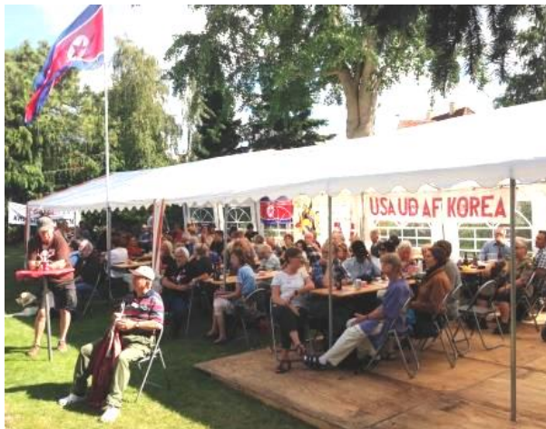
Fra en tidligere Roskilde Minifestival, hvor der ikke var tvivl om Venskabsforeningens tilstedeværelse.

Der bliver desværre ikke K-Festival i år, hvor Venskabsforeningen ellers plejer at deltage med en bod. Men til gengæld vil du finde foreningens bod hos Roskilde Minifestival lørdag den 1. september 2018 kl. 11.00-18.00 . Det foregår på Strandengen 11, Roskilde (i gåafstand fra Roskilde Station).