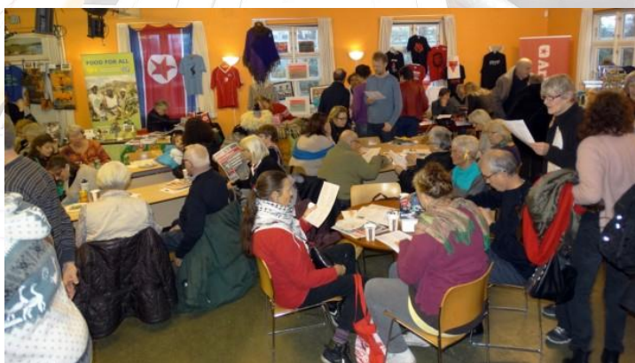
Fra Verdensjulemarked i Valby

Husk Venskabsforeningen vil igen i år være at finde på Verdensjulemarked med et salgsbord søndag den 1. december 2019 kl. 13.00-18.00 i Casa Latinoamericana, Høffdingsvej 10, Valby . S-tog linje F eller bus 1A til Vigerslev Alle Station lige til døren.