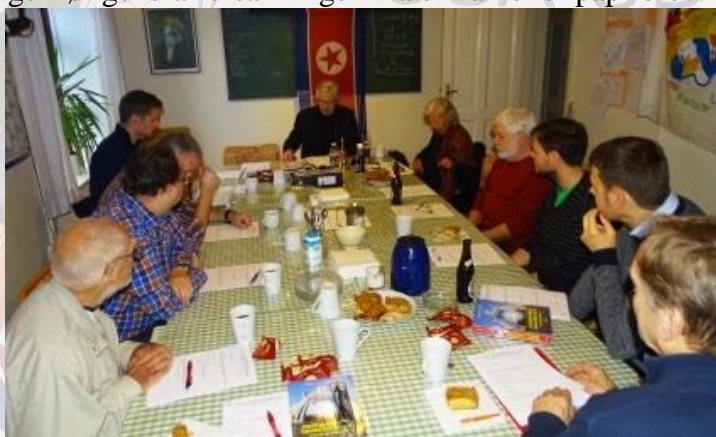
Fra generalforsamling Venskabsforeningen

Venskabsforeningen afholder ordinær generalforsamling lørdag den 30. november 2019 kl. 14.00 i Nordvest Bogcafe, Frederikssundsvej 64, København NV . Der udsendes indkaldelse med dagsorden til alle medlemmer senest 4 uger før generalforsamlingen via e-mail eller papirbrev. Notér datoen allerede nu.