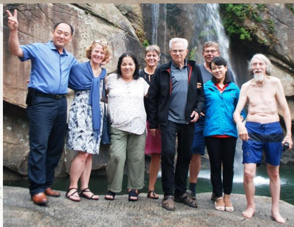
Billeder fra Venskabsforeningens delegations besøg i Korea i juli 2019