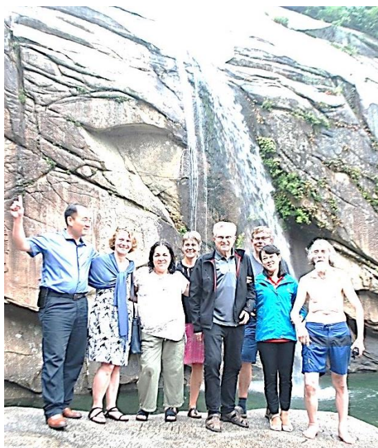
Venskabsdelegation efter en svømmetur under Pakjon-vandfaldet.

Vi forlod Kaesong med fyldte maver for at se et natur område med et vandfald. Vi kørte ad små snoede veje med skove og åbne landskaber til Songdo-området med Pakjon vandfaldet, som ligger ca. 16 km nord for Kaesongs centrum. Min kone og jeg havde læst programmet og taget badetøjet med. Vi fik os en dejlig svømmetur i det klare vand. På vejen tilbage til Pyongyang gjorde vi holdt ved Te-huset.