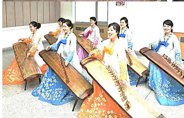
Traditionelle koreanske musikinstrumenter Jonggu-trommer og Kayagum-strenginstrument.