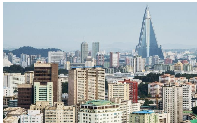
Pyongyang – en moderne og smuk storby

Under den tre år lange Koreakrig (1950 - 1953) blev byen fuldstændig ødelagt af USA's massive bombardementer. Genopbygningen af Pyongyang har kostet mange menneskelige kræfter. En by genopbygget med udgangspunkt i en bunke murbrokker. Den er blevet så flot med grønne parker, nye boliger og skulpturer. En by med sporvogne, trolleybusser, metro, tunneler og et rigt folkeliv. Under generalsekretær Kim Jong Uns ledelse er den i fuld gang med at blive omdannet til en moderne og smuk by. I det nye Pyongyang bliver der tænkt over, hvordan bygningerne skal se ud.