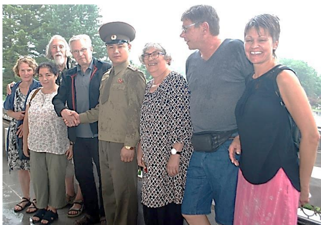
Den danske venskabsdelegation i Panmunjom.

Vi forlod Kaesong med fyldte maver for at se et natur område med et vandfald. Vi kørte ad små snoede veje med skove og åbne landskaber til Songdo-området med Pakjon vandfaldet, som ligger ca. 16 km nord for Kaesongs centrum. Min kone og jeg havde læst programmet og taget badetøjet med. Vi fik os en dejlig svømmetur i det klare vand. På vejen tilbage til Pyongyang gjorde vi holdt ved Te-huset.