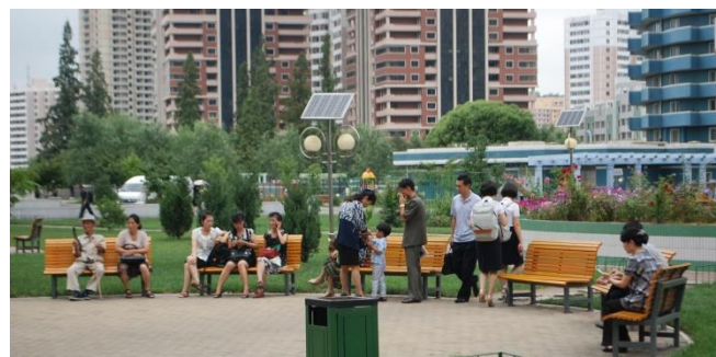
Folkeliv i Ryomyonggaden

tid. Hver fredag giver børnene en teater- og sang forestilling for deres forældre og andre gæster. Og børnene gjorde det rigtig flot.