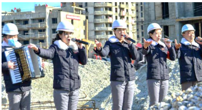
Et eksempel på en musikalsk brigade der spiller for bygge- og anlægsarbejdere i DDF Korea

også givet mulighederne for at skabe den selv, gennem en lang række kulturtilbud som gratis adgang til musikinstrumenter og undervisning i kunstformer. Disse kulturtilbud anser arbejder-staten i DDF Korea som dybt nødvendige for opretholdelsen af socialismen, da det handler om arbejderklassens velfærd og velvære.