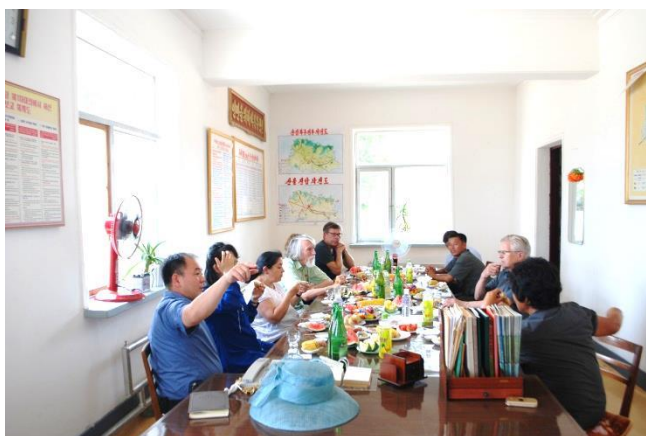
Kooperativformanden Han byder på frokost bestående af lokalt producerede fødevarer.

På vej tilbage til Pyongyang besøgte vi sæbefabrikken Ryongaksan. Fabrikken er af nyere dato. Her bliver produktionen også overvåget via computerstyring. På fabrikken