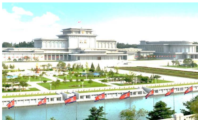
Parken foran Kumsusan-paladset.

Vi blev derefter guidet ud i parken udenfor paladset, som er stor og smuk. Den blev åbnet for folket af Kim Jong Un efter tidligere at have været en paradeplads større end Den Himmelske Fredsplads i Beijing.