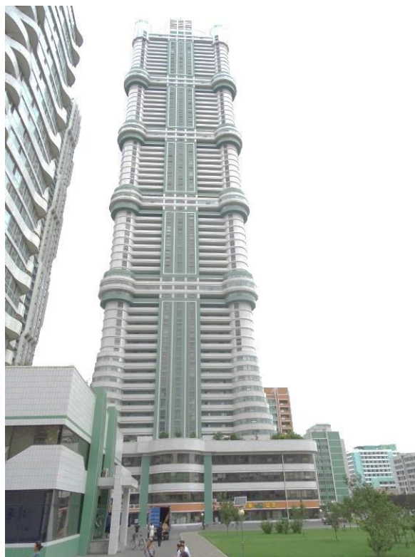
Et af højhusene i Ryomyonggaden

Efter frokost kørte vi til Børnepaladset ”Mangyongdae”. Her kom vi på besøg i forskellige klasseværelser og hvor man øver i forskellige instrumenter f.eks. fløjte, trækharmonika, dans, sang, kunstneriske tegning og flere andre ting. Undervisning i sommerferien og efter skoletid