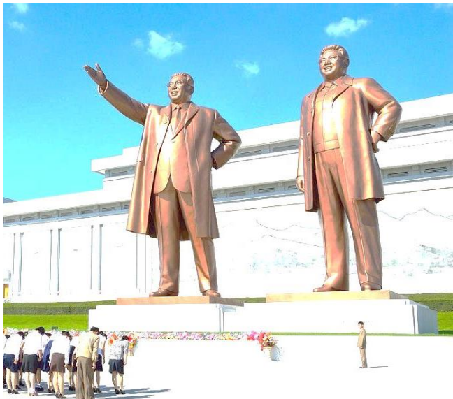
Nye statuer af Kim Il Sung og Kim Jong Il.

Det står ved Moran Hill, ikke langt fra Triumfbuen. Det blev bygget i Juche 48 (1959) til minde om martyrerne det kinesiske folkets frivillige (1,5 mil.), der hjalp det koreanske folk under fædrelandskrigen.