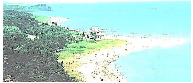
Sijung-stranden på Koreas østkyst

På den anden side af søen mod øst lå en restaurant med butik og masser af strand ud til Østhavet. Regnen var heldigvis stoppet, og det gjorde, at de fleste af os fik skiftet til badetøjet. For bades skulle der. Flot strand. Her var mulighed for en sejltur til de små klippeøer langs kysten. Hvis bølgerne ikke havde været så høje havde vi været på ø-opdagelse, men ak. Men en muslingefrokost med øl og snaps nyd vi dog bagefter.