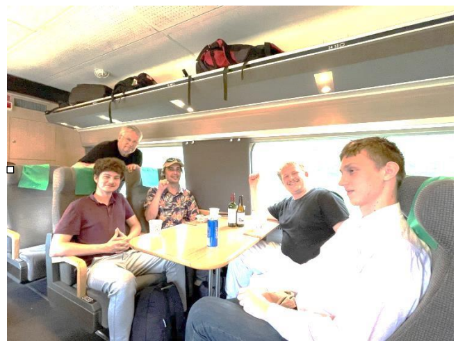
På vej med tog til ambassaden i Stockholm