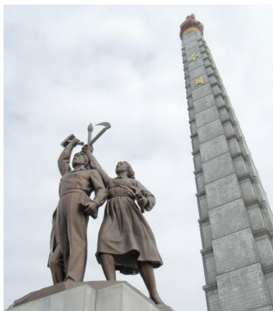
Juche-tårnet i Pyongyang

Om eftermiddagen tilbage i Pyongyang besøgte vi Juchetårnet. Det ligger på bredden af Taedong-floden i den østlige del af Pyongyang. Det blev opført i april 1982 i anledning af præsident Kim Il Sung's 70-