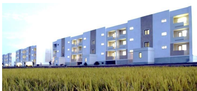
Nye boligblokke i Kangwon-provinsen

En trendy arkitektonisk design skyder op over hele landet i kølvandet på de seneste, destruktive tyfoner