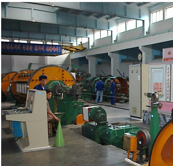
Fra Pyongyang Kabelfabrik nr. 326.

Dagens første besøg var et besøg på Pyongyang Kabelfabrik nr. 326 . 326 refererer ikke til, at der findes så mange kabelfabrikker i byen, men til datoen 26. marts, hvor DDF Koreas tidligere leder kammerat Kim Jong Il i 1998 fremlagde teser om mønstervirksomheder i industrien. Guiden på fabrikken fortæller, at fabrikken blev grundlagt i 1959 og er statsejet. Fabrikken har egen vuggestue og en række velfærdsgoder bl.a. sportscenter, restaurant og lokaler som medarbejderne kan bruge til