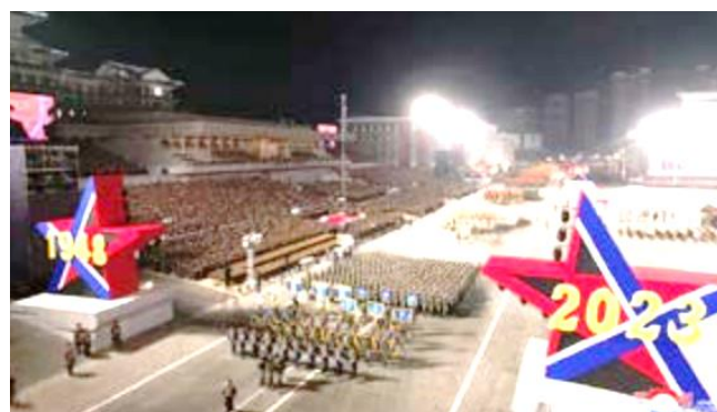
Militær nytårsparade i Pyongyang 2023

De to arbejdsmetoder, Taean og Ch'ongsan-ri, sikrer altså, at landets proletariat er herrer over sig selv og derfor kan være selvstændigt, bevidst og kreativt. Arbejderdemokrati er essentielt for en trivende socialistisk stat, og derfor er det positivt at D.D.F. Korea har implementeret disse to demokratiske arbejdsmetoder. Derudover er det altafgørende for den socialistiske stat i Korea at bevare og udvikle de to arbejdsmetoder samt landets planøkonomi. At eksperimentere med markedsreformer ville destabilisere den socialistiske stat og er ikke vejen frem for D.D.F. Korea. Det er tydeligt at se, at de Koreanske arbejdsmetoder har sikret landets fortsatte (socialistiske) eksistens. Den nye æra ser lovende ud for D.D.F. Korea, og det Koreanske arbejderparti ledet af General-Sekretær Kim Jong Un, som fortsat bevarer og udvikler socialismen. Juche-ideologien har bragt sejr til D.D.F. Korea, og dette på trods af utrolige mængder af modstand. Det er vigtigt aktivt at studere D.D.F. Korea og Juche-ideologien, for der er rigtigt mange spændende teoretiske såvel som praktiske erfaringer at finde. Taean og Ch'ongsan-ri er blot en lille del af den Koreanske socialisme, så der er rigeligt at undersøge og forstå.