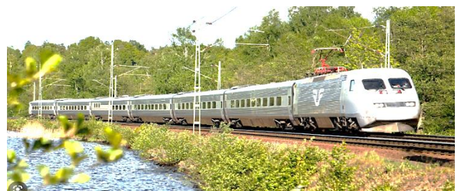
En hyggelig og bæredygtig rejse med SJ's lyntog X2000 – ”Ett bra miljöval”.