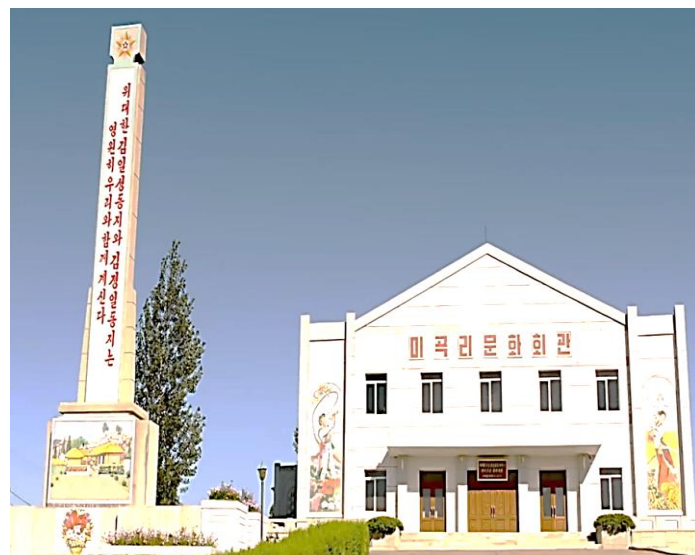
Et lokalt kulturcenter ("문화회관" eller "munhwa hoegwan") hvor landbefolkningen underholdes af lokale- og udefrakommende kunsttrupper. Her fra Miguk-ri landbrugs-køoperativet i Sydhwanghae-provinsen.

Tidligere på måneden viste Nordkorea tegn på yderligere regulering af sit robuste mobilmarked, hvor statslige medier kunne rapporte om en ny "lov om mobil telekommunikation". Hidtil har Nordkorea videregivet meget få detaljer om loven, og en kopi af lovgivningen er endnu ikke dukket op.