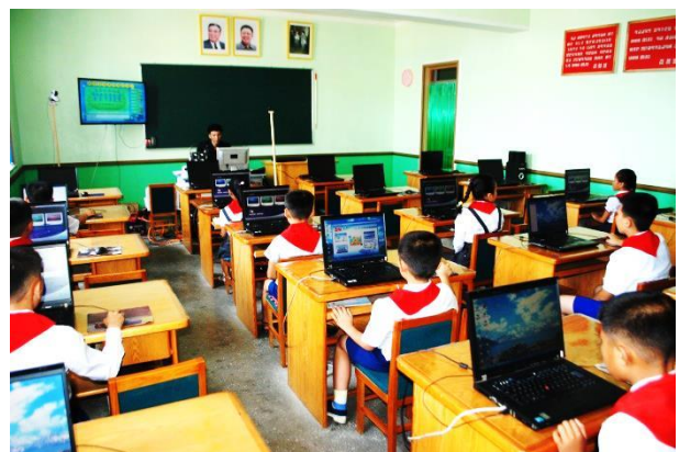
Engelskundervisning med PC'ere på Toksong grundskole

Om eftermiddagen kørte vi til Sunchon området mod nord i Sydpyongan provinsen. Her ventede nye overraskelser. Vi besøgte Toksong Primary school (grundskole). Børnene har sommerferie i juli, men eleverne har mulighed for ekstra-undervisning. Vi kom ind i en klasse med engelsk undervisning, hvor alle elever også havde en computer. Den obligatoriske 12-årige skolegang er gratis og dækker alle børn og unge i alderen 6 til 17 år.