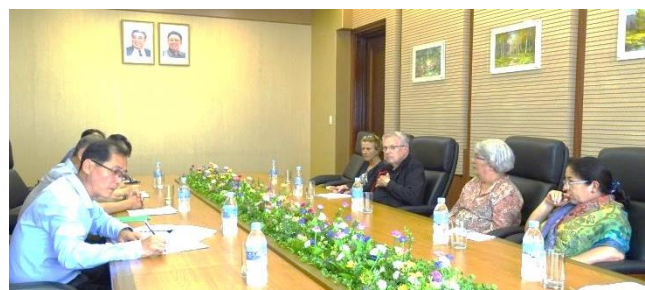
Møde med repræsentanter for KASS.

Efter frokost havde vi et møde på Koryo Hotel med to personer fra Korean Academy of Social Science. De svarede på vores spørgsmål om udviklingen i Korea.