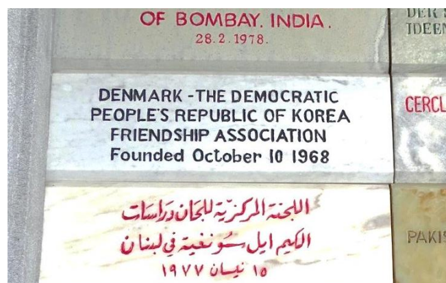
En stennavnetavle i Juchetårnet fra Venskabsforeningen skænket ved indvielsen i 1982.

årsdag for altid at huske de ideologiske og teoretiske tanker fra præsidenten, der er forfatter af Juche-ideén.