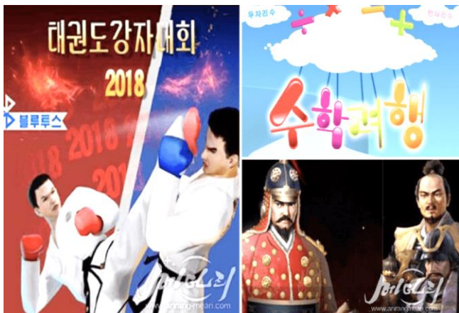
Billede: Fra venstre med uret, "Taekwondo Konkurrence", "Math Travel" og "Imjin War." Bluetooth-symbolet ses i venstre side af det første billede.