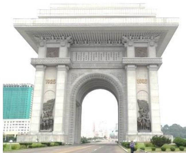
Triumfbuen i Pyongyang

Når man kører fra lufthavnen, passerer man på venstre side De Tre Revolutioners Udstilling i en park. Udstillingshallerne i parken viser de resultater, som det koreanske folk har opnået gennem årene i gennemførelsen af de tre revolutioner: Den ideologiske-, den tekniske- og den kulturelle revolution. Hallen med nye teknologiske opfindelser er vært for sådanne udstillinger som Pyongyang International Trade Fair, der årligt finder sted.