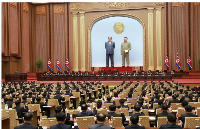
Fra lokalerne i den Øverste Folkeforsamling, 2026

Den første samling i DDF Koreas nyvalgte parlament blev afholdt i dagene mellem den 22. – 23. marts 2026. Her mødtes de 687 medlemmer for at drøfte vigtige dagsordenspunkter, heriblandt valg til DDF Koreas vigtigste post som Præsident af Kommissionen for Statsanliggender (KS).