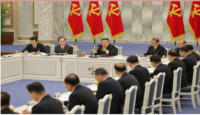
Møde i Politbureauet den 25/02/26