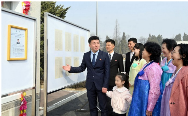
Vælgere ser information om opstillede kandidater

Mange er ikke klar over at DDF Korea har valg til sit parlament "Den Øverste Folkeforsamling", mens andre ikke mener at valget er demokratisk. I denne artikel går vi i dybden med det nyligt afholdte valg den 15. marts 2026.