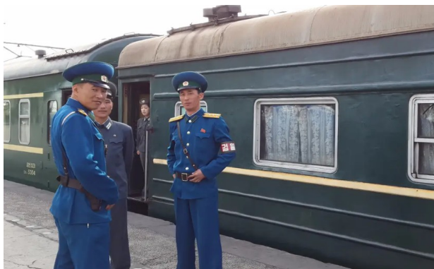
Billede fra 2015, hvor det rullende materiel ofte var af noget ældre dato.

Ligesom Australien og andre lande lukkede Nordkorea sine grænser fuldstændigt under coronaepidemien. Torsdag den 12. marts blev togtrafikken til Kina endelig genoptaget.