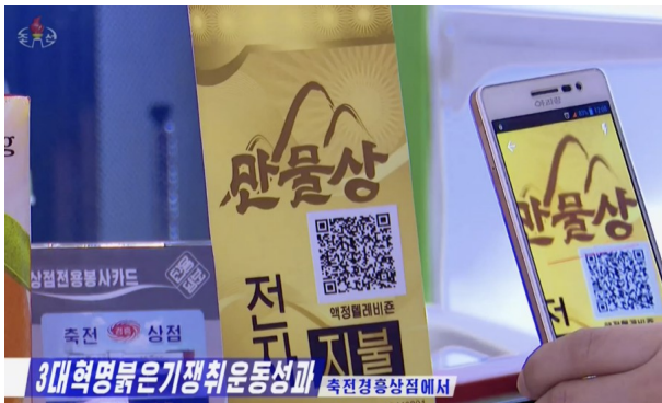
App'en "Manmulsang" betaler via QR-koder

Livet er blevet lettere for millioner i DDF Korea, efter at stigende digitalisering har fundet sted i samfundet. I Bulletin fra Maj 2023 kunne vi bringe nyheden om udbredelsen af smartphones i DDF Korea, og siden da er udviklingen gået hastigt fremad.