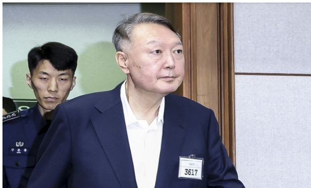
Eks-Præsident Yoon Suk Yeol i retten, 09/2025

Den 15. januar 2025 skete der noget uhørt i Sydkoreas moderne historie. Den konservative præsident Yoon Suk Yeol blev arresteret efter et omfattende kupforsøg, der bragte grimme minder fra landets årtier under militærdiktatur.