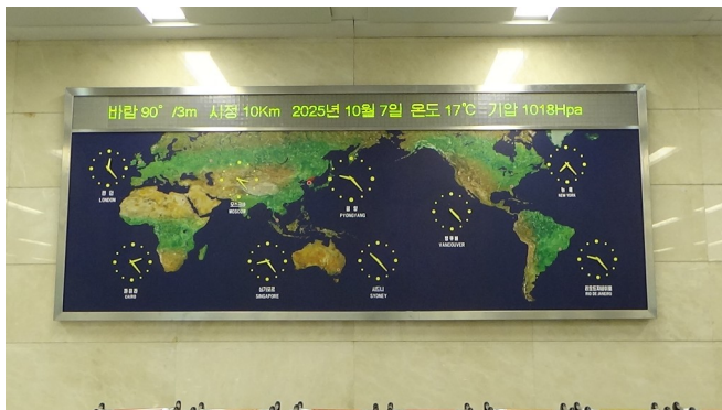
Verdenskort fra Pyongyang

Det var ikke kun for hotellets gæster at adgang til omverdenen var mulig. På universitetet fik vi lov at scrolle rundt på computeren, hvor jeg ved et tilfælde fik åbnet op for Google. Det var altså ikke noget jeg skulle se, hvilket bekræfter at der i hvert fald på nogle institutioner er en vis grad af adgang til udenlandets hjemmesider.