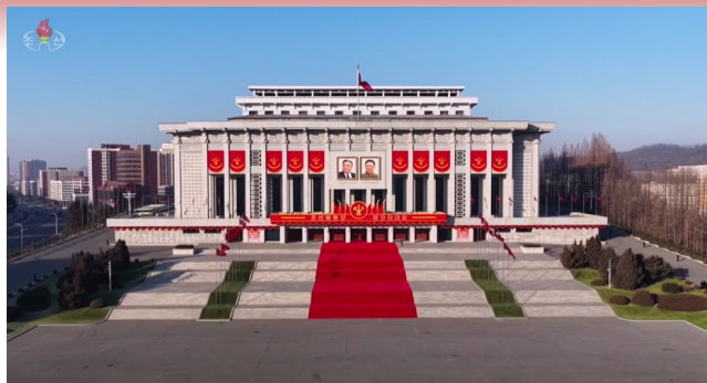
"25. April Kulturhuset" hvor kongressen afholdes

Dernæst blev dagsordenspunkterne behandlet, med indlæg fra talerstolen og videre diskussion heraf. Over fire dage mødtes kongressen, hvor femtedagen bød på møde i den nyvalgte ledelse. De sidste to dage bød på andre aktiviteter.