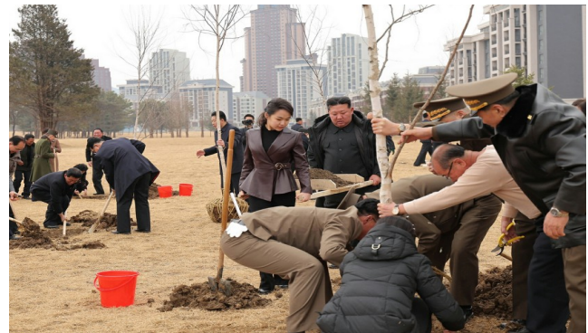
Kim Jong Un og hans datter planter træer, 2026

Den 14. marts er en særlig interessant dato i DDF Korea. Det er nemlig den årlige "nationale træ-plantningsdag", hvor folk i hele landet planter nye træer for at opretholde biodiversiteten, og for at bevare de grønne områder i byerne.