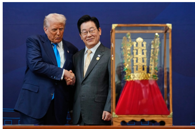
Lee Jae Myung giver en historisk krone til Trump

Donald Trump sagde den 6. april 2026 at USA har over 45.000 amerikanske soldater udstationeret i Sydkorea, for at beskytte landet mod sin nordlige nabo. Som vi ved er Trump kendt for at lyve, men de titusindvis af tropper og dertilhørende baser er et velkendt faktum. Årsagen til den militære tilstedeværelse skyldes dog nærmere et ønske om at få kontrol over DDF Korea, som er en torn i øjet på USA’s strategiske interesser. Derfor afholdes der årligt massive krigsøvelser mellem Sydkorea, Japan og USA.