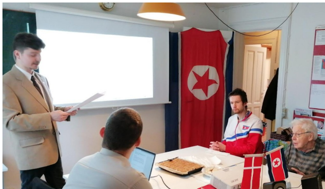
Fra Generalforsamlingen i NV Bogcafé.

Foreningen afholdte sin årlige Generalforsamling lørdag den 30. november 2025. Der var 14 medlemmer fremmødt, og mødet startede ud med en politisk og organisatorisk beretning fra formanden, der for nyligt havde været i Pyongyang.