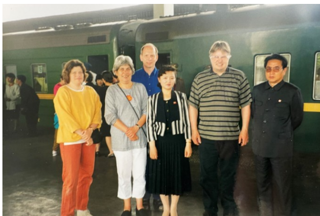
En af vores forenings tidligere venskabsdelegationer, som netop er ankommet på Pyongyang Hovedbanegård

China Railway meddeler desuden, at der vil være en daglig forbindelse mellem Dandong og Pyongyang